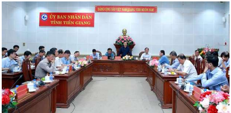
Phó Thủ tướng Trần Hồng Hà phát biểu tại cuộc họp

Về hoạt động sản xuất, tháng 9/2023, có khoảng 56.260 ha lúa vụ Đông Xuân và 43.300 ha cây ăn trái được Bộ NN&PTNT chỉ đạo khuyến cáo thuộc vùng nguy cơ ảnh hưởng của xâm nhập mặn. Các tỉnh đã triển khai nhiều giải pháp để bảo vệ các diện tích trồng lúa, cây ăn trái. Toàn bộ diện tích lúa có nguy cơ ảnh hưởng của xâm nhập mặn được đẩy sớm thời vụ gieo trồng từ tháng 10, 11, kết thúc trong tháng 12/2023. Các diện tích cây ăn trái được