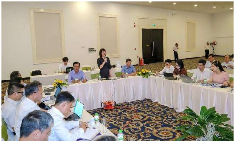
Quang cảnh cuộc họp tham vấn

Sau khi nhận được Thông báo chính thức của Campuchia về Dự án, Ủy ban sông Mê Công Việt Nam đã trao đổi song phương với phía Campuchia ở các cấp để nêu quan ngại của Việt Nam về tác động của Dự án tới Đồng bằng sông Cửu Long, và đề nghị phía Campuchia chia sẻ các thông tin chi tiết về Dự án, bao gồm Báo cáo khả thi dự án, cũng như đề nghị tiến hành nghiên cứu chung về tác động của Dự án và áp dụng Hướng dẫn đánh giá tác động xuyên biên giới của Ủy hội sông Mê Công quốc tế cho Dự án nhằm đạt được