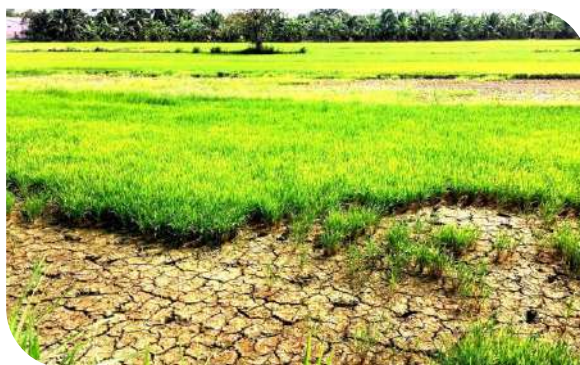
Hạn mặn ở ĐBSCL khiến nhiều diện tích lúa bị thiệt hại.

Bố trí ngân sách địa phương để triển khai thực hiện các giải pháp phòng, chống hạn hán, xâm nhập mặn; ưu tiên bố trí kinh phí để đẩy nhanh tiến độ đầu tư xây dựng, sửa chữa, nâng cấp công trình phục vụ cấp nước, kiểm soát nguồn nước, đặc biệt công trình cấp nước sinh hoạt tập trung, công trình lấy nước ven sông và hồ chứa nước ngọt.