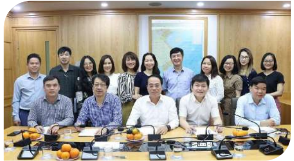
Lãnh đạo các đơn vị thuộc Khối Thi đua số IV thống nhất Đăng ký giao ước thi đua năm 2024

Đặc biệt, nhằm tạo động lực thúc đẩy phong trào thi đua, Khối thi đua số IV cũng phát động các phong trào thi đua gắn kết tuyên truyền về các nhiệm vụ chính trị của Bộ trong từng lĩnh vực quản lý nhà nước đối với việc tổ chức các hoạt động văn hoá, văn nghệ, thể thao chào mừng các ngày lễ của đất