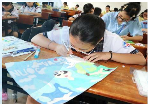
Các thí sinh thể hiện nội dung tranh theo chủ đề cuộc thi

Thông qua cuộc thi, ban tổ chức mong muốn sự đồng hành, chung tay của các em học sinh, các trường học và người dân trên địa bàn thành phố để lan tỏa, nâng cao ý thức về những vấn đề môi trường nước như sử dụng nước tiết kiệm, hạn chế khai thác nước dưới đất, vận động gia đình trám lấp giếng khoan, sử dụng nguồn nước sạch đạt quy chuẩn của Bộ Y tế... ❖