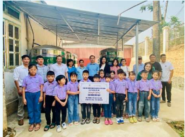
Đại diện đơn vị tổ chức và các em học sinh chụp ảnh lưu niệm tại lễ khánh thành và bàn giao công trình nước sạch

Đại diện Quỹ Toyota Việt Nam chia sẻ: “Quỹ Toyota Việt Nam hy vọng rằng công trình nước sạch sẽ đem lại điều kiện sống tốt hơn, giúp các em học sinh và thầy cô giáo yên tâm