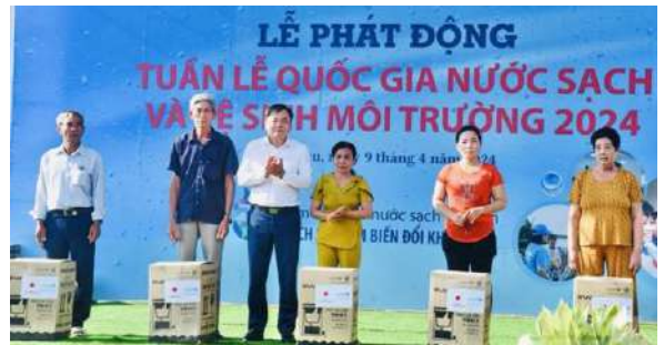
Thủ tướng Nguyễn Hoàng Hiệp trao tặng máy lọc nước cho người dân ở Cà Mau.

Thứ trưởng Bộ Nông nghiệp và Phát triển Nông thôn Nguyễn Hoàng Hiệp cho biết, mặc dù đã rất nỗ lực nhưng hiện vẫn còn 43% người dân nông thôn chưa có nguồn nước hợp quy chuẩn quốc gia sử dụng. Giảm tỷ lệ này không những là mục tiêu mà còn là áp lực rất lớn. Tại 13 tỉnh, thành phố thuộc khu vực Đồng bằng sông Cửu Long đang có khoảng 50.000 hộ thiếu nước sạch, phải sử dụng nhiều giải pháp khác nhau đảm bảo có nước sạch sinh hoạt. Điển hình tại Cà Mau, hiện khoảng 4.000 hộ phải dùng biện pháp khẩn cấp để có nước sạch phục vụ nhu cầu sinh hoạt.