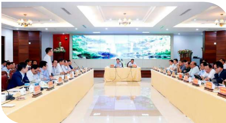
Quang cảnh buổi làm việc

Trên cơ sở các đề xuất của tỉnh Gia Lai, các thành viên trong Đoàn công tác của Bộ TN&MT đã tiếp thu và có ý kiến