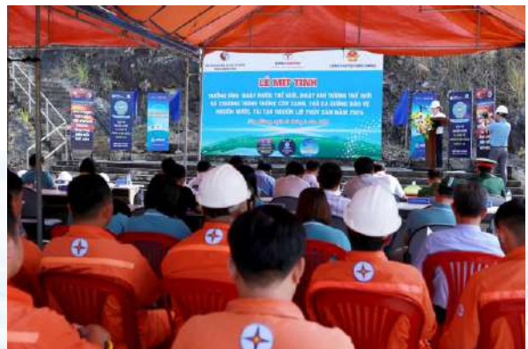
Quang cảnh Lễ mít tinh hưởng ứng ngày Nước thế giới, ngày Khí tượng thế giới năm 2024 tại Nhà máy thủy điện Sông Bung 4

Hoạt động này vừa giúp tái tạo và phát triển nguồn lợi thủy sản, vừa truyền đi thông điệp bảo vệ môi trường, thích ứng biến đổi khí hậu, bảo vệ nguồn nước, gia tăng sinh kế cho người dân sống ở khu vực có các thủy điện... ❖