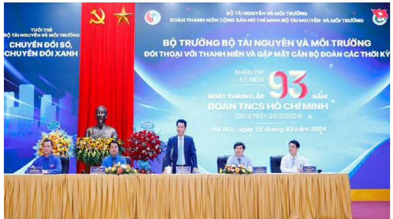
Bộ trưởng Đặng Quốc Khánh đối thoại với đoàn viên, thanh niên Bộ TN&MT.

Theo đó, công tác chính trị, tư tưởng được triển khai đồng bộ, đa dạng và linh hoạt với nhiều đổi mới. Các hoạt