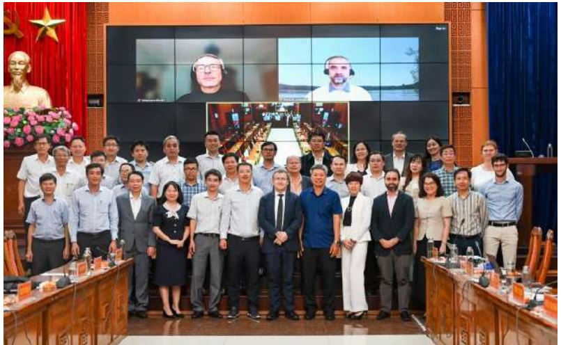
Các đại biểu tham dự cuộc họp chụp ảnh lưu niệm