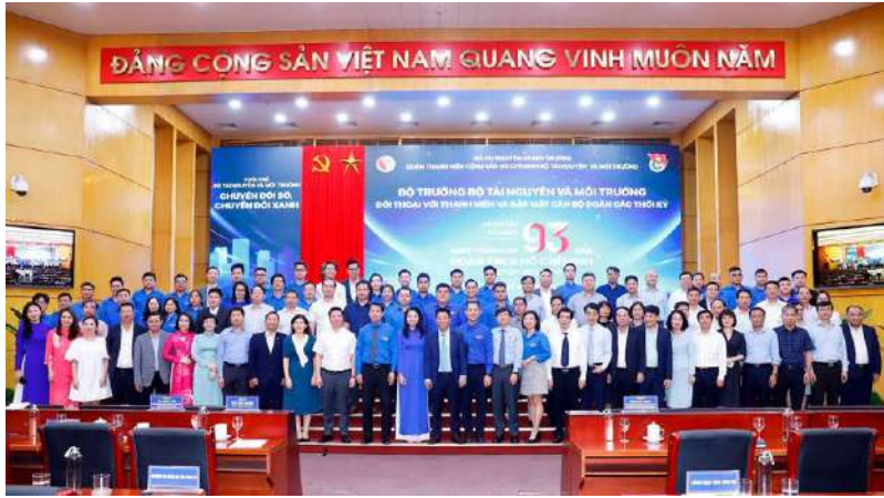
Bộ trưởng Đặng Quốc Khánh chụp ảnh lưu niệm với các đại biểu tham dự Hội nghị.

Tin tưởng vào sức trẻ, tâm huyết và khả năng đổi mới, sáng tạo của thanh niên trong tham gia bảo vệ TN&MT,