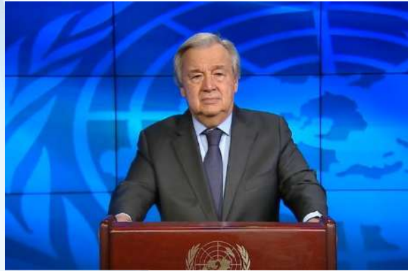
Tổng Thư ký Liên hợp quốc António Guterres

"Nước cho hòa bình" là chủ đề của Ngày Nước Thế giới năm nay. Để đạt được điều này cần sự hợp tác nhiều hơn nữa. Tổng cộng có 286 lưu vực sông và hồ nước xuyên biên giới và 592 tầng chứa nước xuyên biên giới được chia sẻ bởi 153 quốc gia. Tuy nhiên, chỉ có 24 quốc gia được báo cáo là có thỏa thuận hợp tác đối với nguồn tài nguyên nước chia sẻ của họ. Chúng ta phải tăng cường nỗ lực hợp tác xuyên biên giới và tôi kêu gọi tất cả các nước cùng tham gia và thực hiện Công ước về Nước của Liên hợp quốc - nhằm thúc đẩy quản lý chia sẻ tài nguyên nước một cách bền vững.