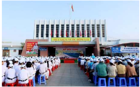
Quang cảnh buổi lễ