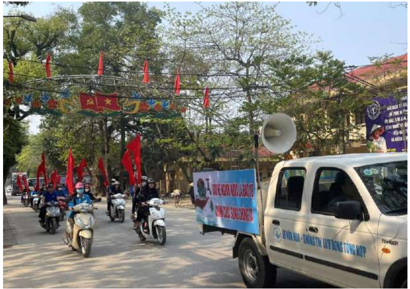
Đoàn viên thanh niên đã tham gia diễu hành tuyên truyền về vai trò và tầm quan trọng của tài nguyên nước

Thông qua các hoạt động tại buổi lễ mít tinh nhằm góp phần nâng cao nhận thức cho cộng đồng trong việc quản lý, bảo vệ, khai thác và sử dụng có hiệu quả nguồn tài nguyên nước trước áp lực