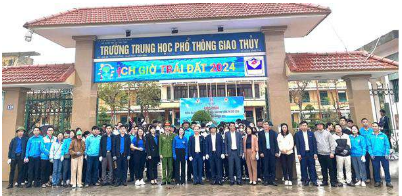
Các đại biểu tham dự Lễ mít tinh

Phát biểu tại chương trình mít tinh, lãnh đạo Sở TN và MT đề nghị các cấp, các ngành tăng cường tuyên truyền, phổ biến Luật Tài nguyên nước năm 2023; sử dụng nước tiết kiệm, hiệu quả; thu hút các dự án xanh, dự án năng lượng tái tạo; quản lý hiệu quả khu bảo tồn thiên nhiên; thường xuyên phát