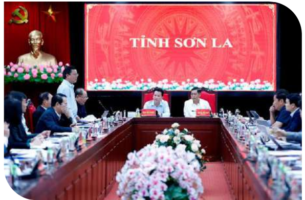
Quang cảnh buổi làm việc

Là tỉnh đầu nguồn của hai lưu vực sông Mã và sông Hồng cùng với việc có 18 hệ thống sông liên tỉnh đi qua, Bộ TN&MT khuyến cáo trong công tác quản lý nguồn nước, lưu vực sông tránh ô nhiễm nguồn nước tới vùng hạ lưu; Chú trọng công tác bảo vệ rừng để tạo hành lang bảo vệ nguồn nước, chống lũ ống, lũ quét, thiên tai... Với việc là tỉnh biên cương, có diện tích rừng che phủ lớn, lãnh đạo Cục Viễn thám cho biết cũng sẵn sàng hỗ trợ Sơn La trong công tác cảnh báo cháy rừng, phát hiện những