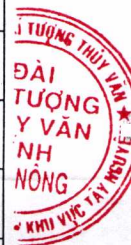
Phụ lục 2: Bảng mực nước, lưu lượng thực đo và dự báo các trạm