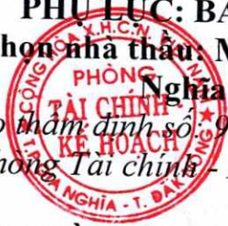
BẢNG 1: TÀI LIỆU KÈM THEO BÁO CÁO THẨM ĐỊNH

(Kèm theo Báo cáo thẩm định số: 90/KQTD-TCKH ngày 09 tháng 10 năm 2020 của phòng Tài chính - Kế hoạch thành phố Gia Nghĩa)