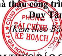
BẢNG 1: TÀI LIỆU KÈM THEO BÁO CÁO THẨM ĐỊNH

của phòng Tài chính - Kế hoạch thành phố Gia Nghĩa)