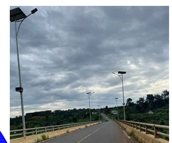
HÌNH HIỆN TRẠNG