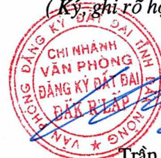
Trần Quốc Trung