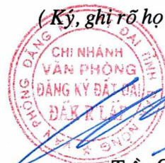
Trần Quốc Trung