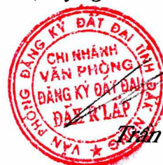
Trần Quốc Trung